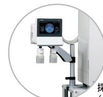
採水ユニットアーム (クランプ型)