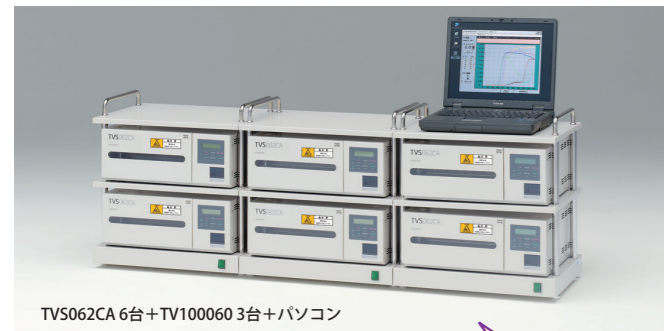
TVS062CA 6台+TV100060 3台+パソコン