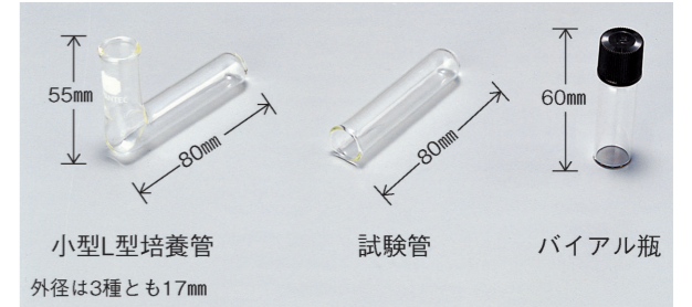
小型L型培養管 試験管 バイアル瓶 外径は3種とも17mm

※2 RS-232Cケーブルは付属しています。付属されているケーブル以外は使用できません。