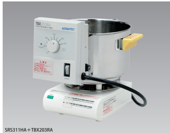
SRS311HA + TBX203RA