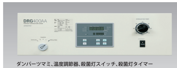
ダンパーつまみ、温度調節器、殺菌灯スイッチ、殺菌灯タイマー