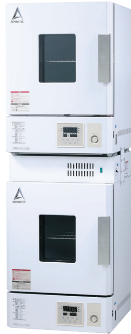
DRN420DE 2台 + ファン付積重ね架台DR000121