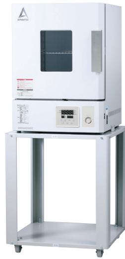
DRN420DE + 架台(キャスター付)DR000061