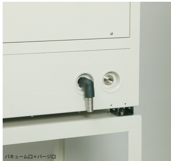
バキューム口+パージ口 ●ガス置換を容易にするためのパージ口を設けてあります。