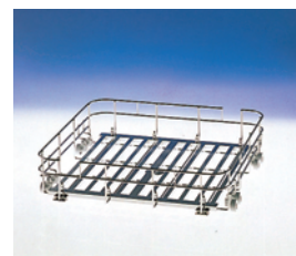
バイアル瓶ジェットラック (MJW-820JR)