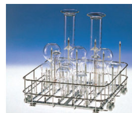
下段ジェットラックセット (MJW-810JRS)