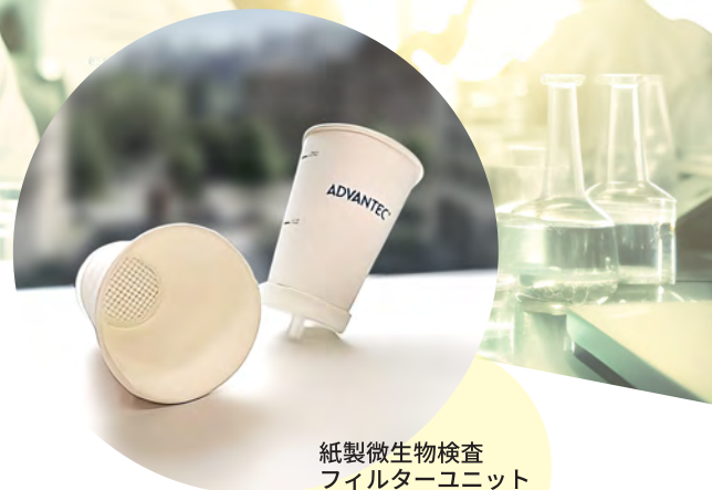
紙製微生物検査 フィルターユニット