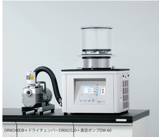
DRW240DB+ドライチェンバーDR002520+真空ポンプDW-60