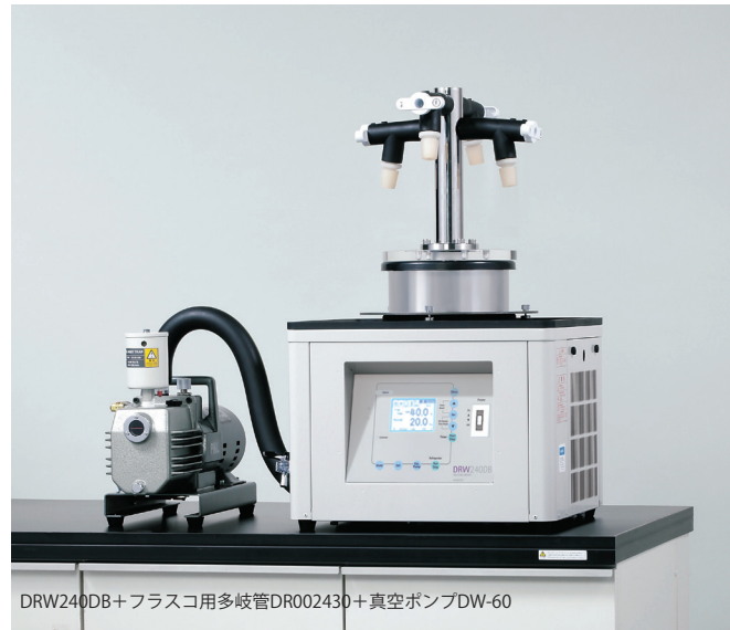
DRW240DB+フラスコ用多岐管DR002430+真空ポンプDW-60