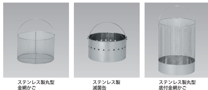
ステンレス製丸型金網かご